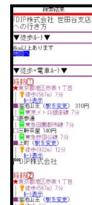
「乗り換えルート」画面