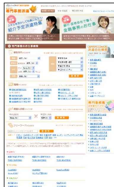
「はたらこ専門事務派遣」のトップ画面