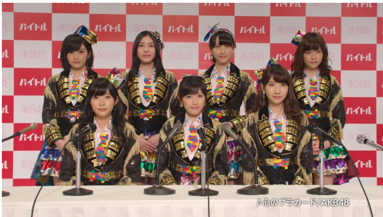
「バイトル」新CM「ライブ告知」篇

このCMのVTR、撮影現場風景の画像等もございますので、下記までご連絡いただければ、お貸し出しさせていただきます。ただし、CM紹介以外での写真の使用、および二次的使用はご遠慮いただきますようお願いいたします。写真素材などに関しては、リリースがお手元に届いた貴紙・誌・番組のみの使用とさせていただきます。他紙・誌・番組への素材の供与および掲載、オンエアは固くお断り申し上げます。掲載、オンエアなどの予定が決定いたしました場合、大変お手数ですが下記宛にご一報頂ければ幸いです。